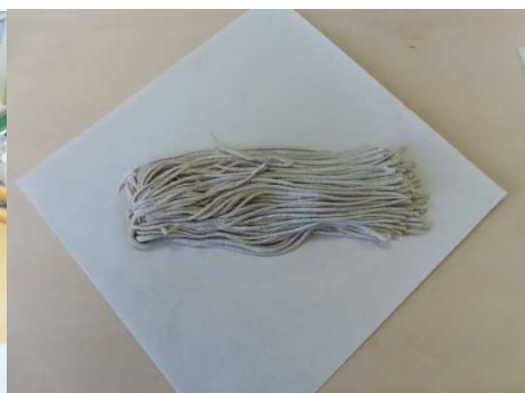
そば打ち初めてですが良い切りです。