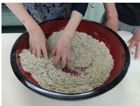
大きな粒がなくて良いですね。