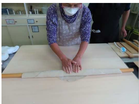
四つだし、四角にします。