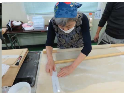
厚みが重要、ゲージで計ります。