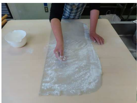
粉を振ってたたみます。