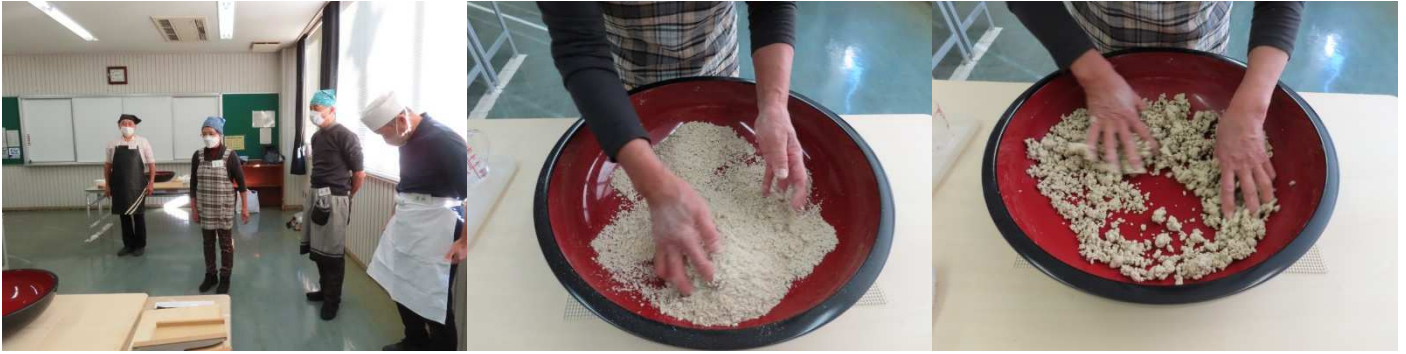
水回し、大きい粒が無くて良いです。