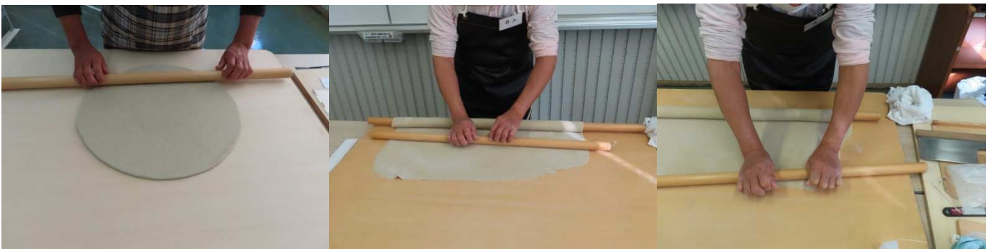
丸出し、見事な丸です。