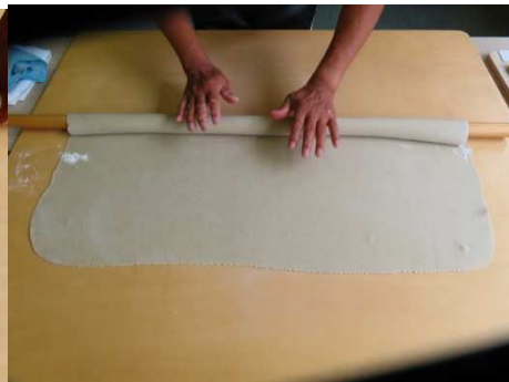
これから本のしします。