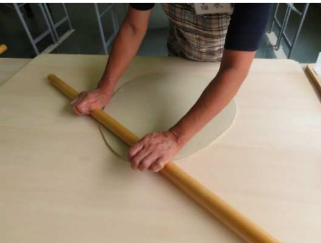
丸出し、のし棒で丸く大きく。