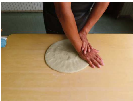
地のし、手のひらで押します。