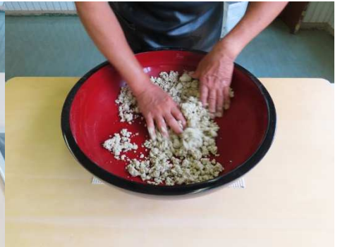
水加減、良いでしょう。