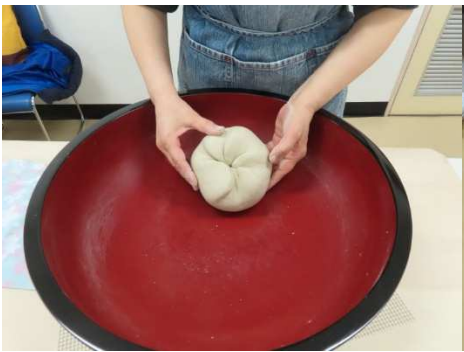
菊練りの終わりです。