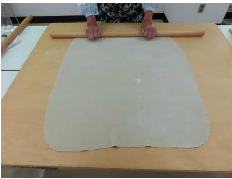
肉分け、巾だしを同時にします。