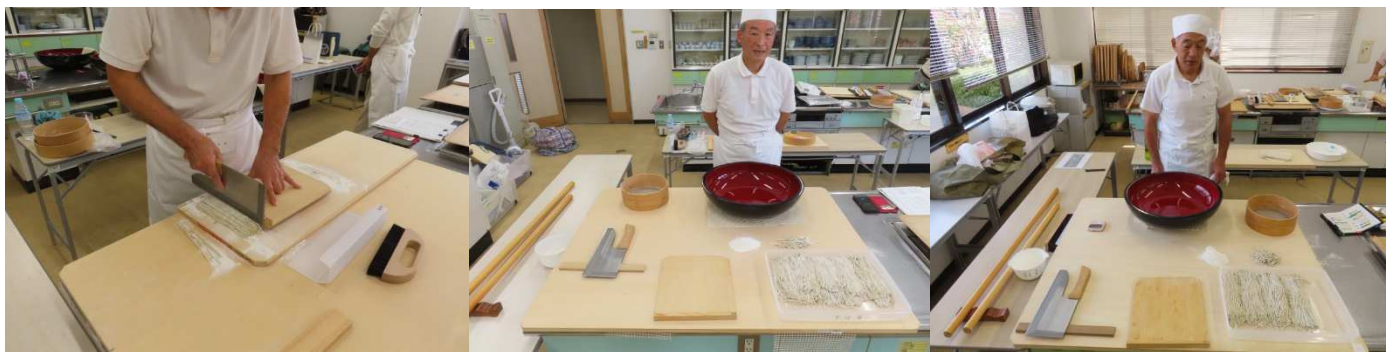
認定会用実技終了スタイル 麺台と麺棒置台に何かある。NG です。