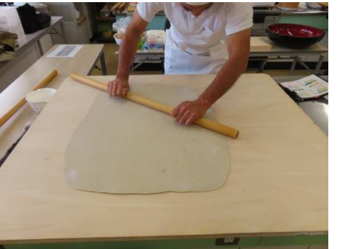
肉分け・巾出しです。