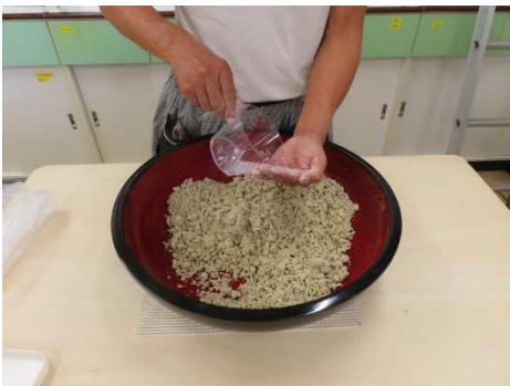
3回目が入り最後の決め水を入れます。