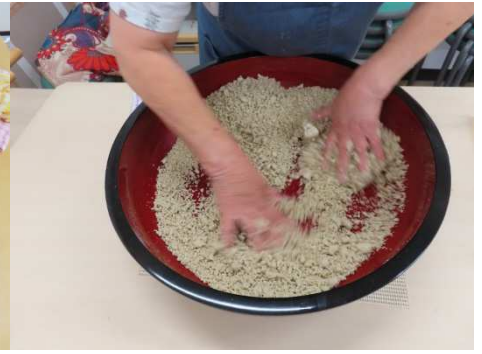
2回目の水を入れました。