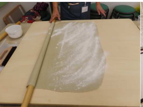
粉を振ってたたみます。