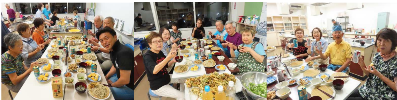
家族の方と新そばを食べる会