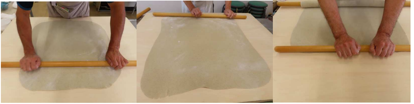
巾だし、今日のそばの長さを決めます。