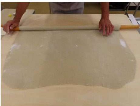
これから本延します。