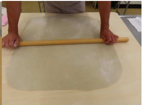
本日のそばの長さを出します。