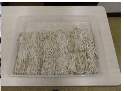
別の方が切って舟に入れました。