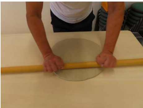
丸く大きく延します。