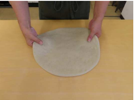
地のしをしました。丸くて良いです。