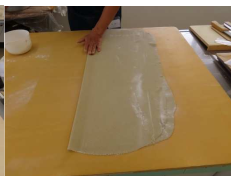
本延し、いまいちですね。