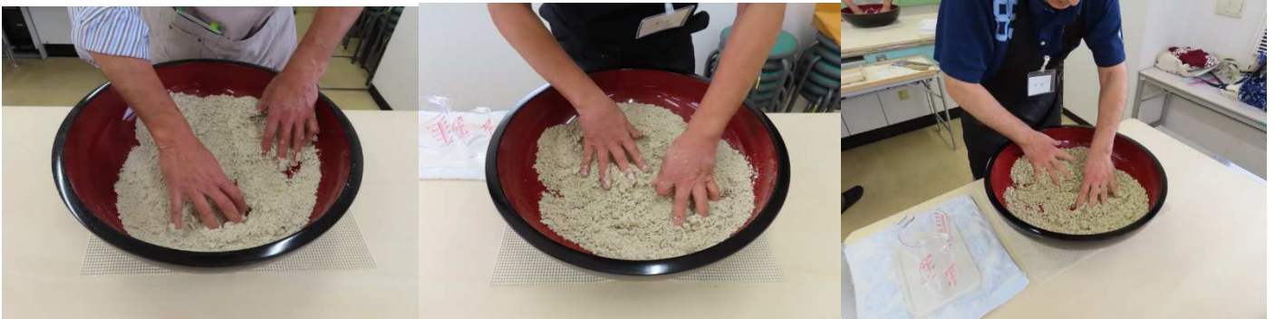
水廻しです。大きい粒が無くて良いですね。