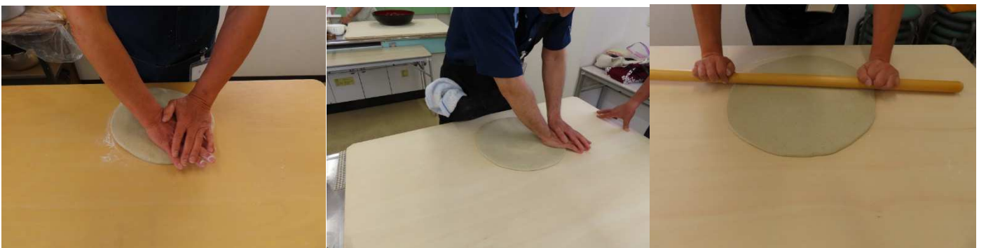
地のし、リズムカルにテンポ良く。