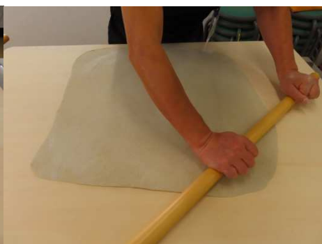
肉分け、良く分けて下さいね。