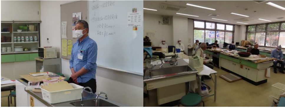
朝礼及び令和5年度総会の模様。