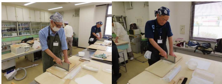
もうちょっとゆったり切ると良いですね。