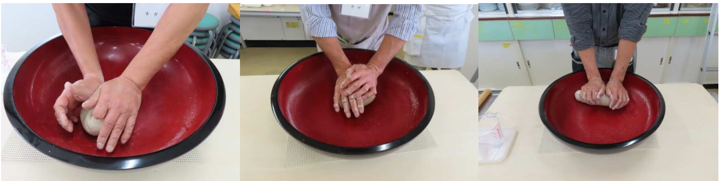
練っています。体で練りましょう。