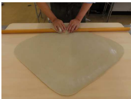
四つだし、素晴らしい。