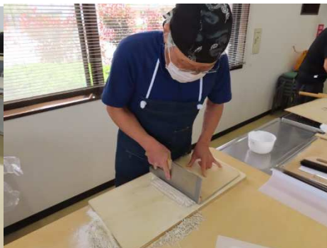
切りです。窮屈な切りですね。