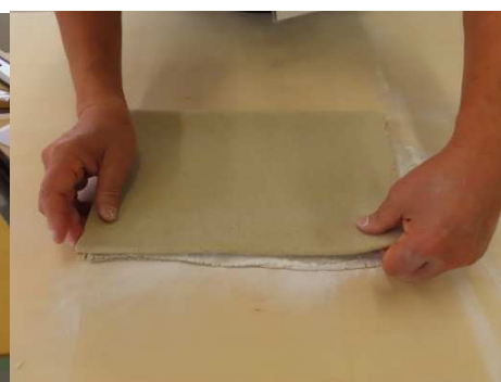
たたんで切ります。