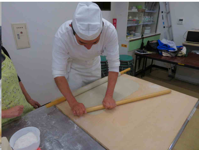
本延しのお手伝いですね。