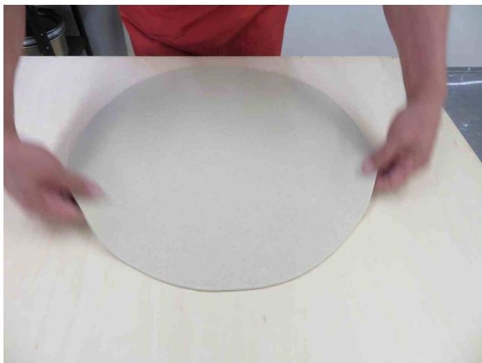
丸出し、丸いですね。