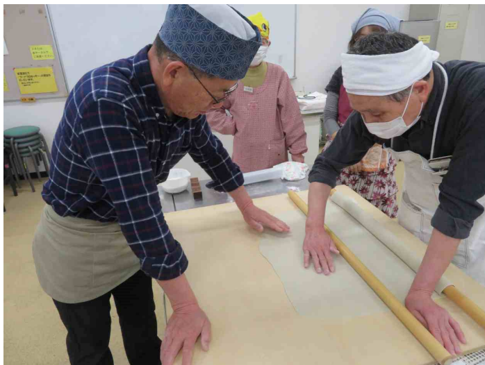
本延しの指導、厚みの確認でしょうか。