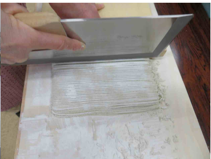
切り揃え良いですね。