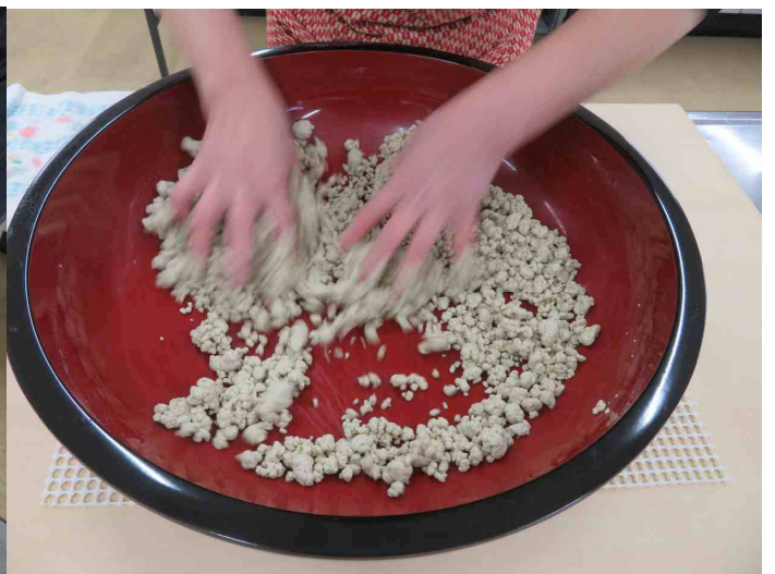
水回し丁度良いでしょう。