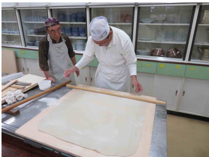
本延し終わったのでしょうか？