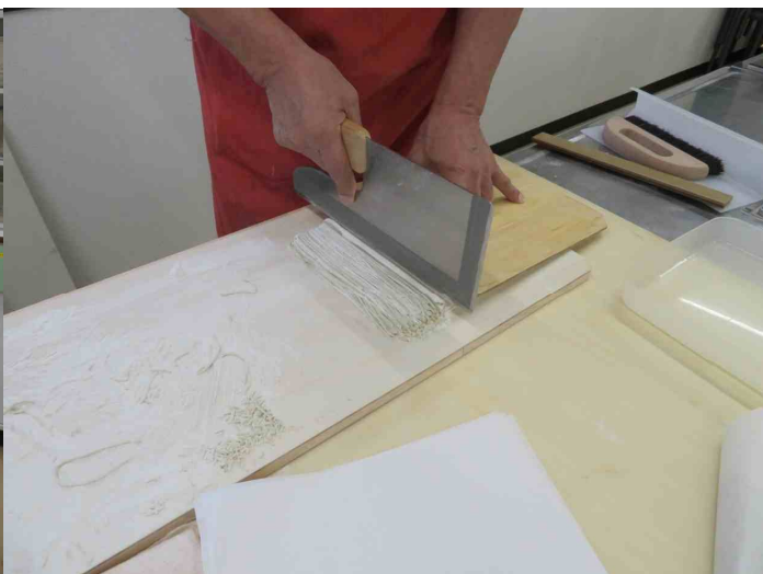
切りです、こちらの方は2段位の腕前です。