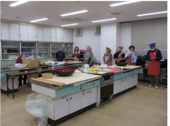
参加者14名の皆さんです。