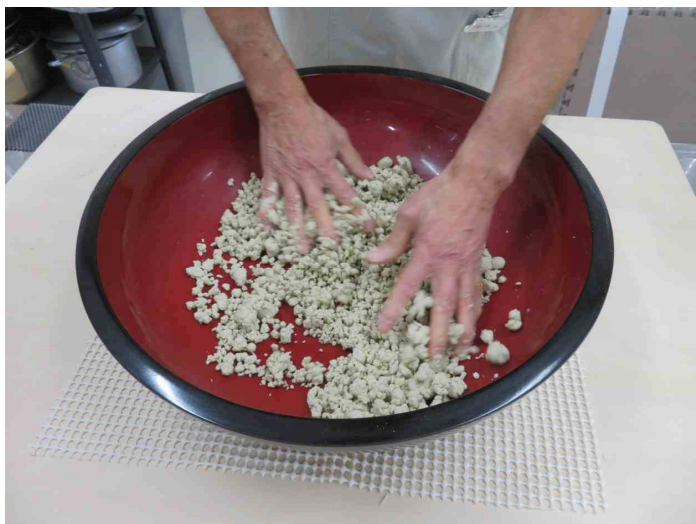
水回し、粒が小さくて良いですね。