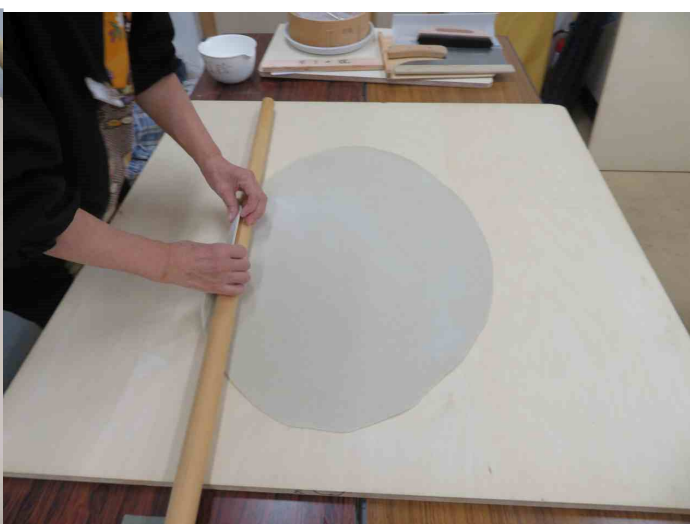
四つ出しに入りました。大きさ良いです。