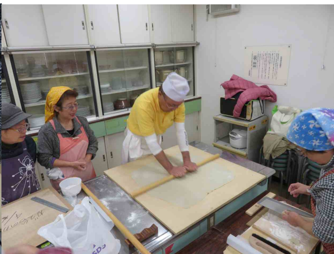
相吉講師のお手伝い。