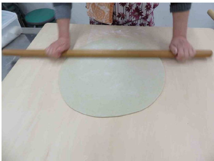
丸出し良いですね。