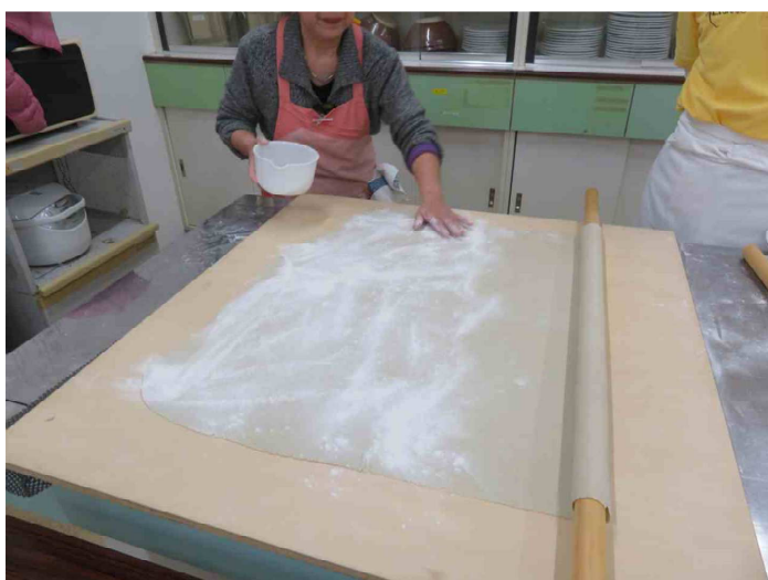
本延し終わってたたみます。