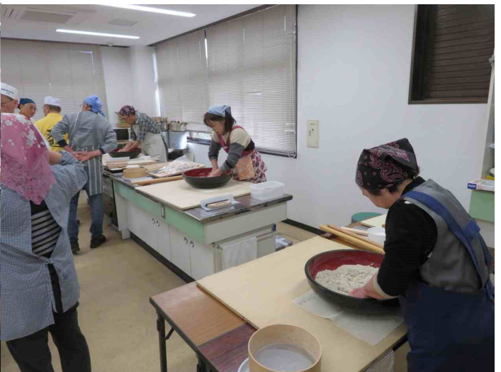
そば打ち始めました、水回しです。