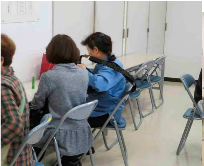
いらっしやいませ、只今お持ちします。