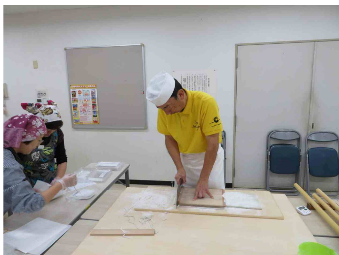
こちらも切っています。