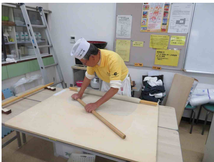
そばを打っています。