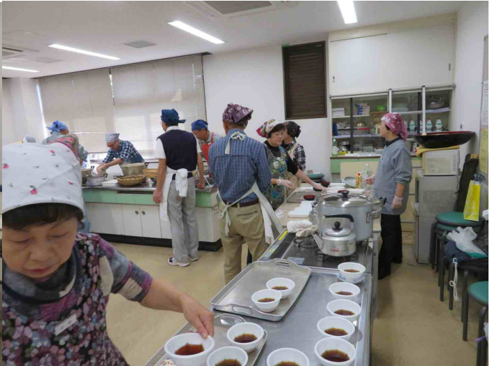
釜前さんが茹でています。