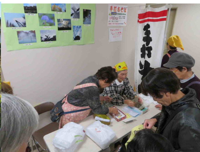
もりそば、持ち帰りそばのチケット販売しています。