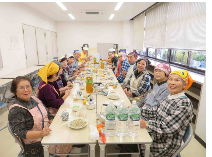
終わりましたお疲れ様、みんなでお昼です。