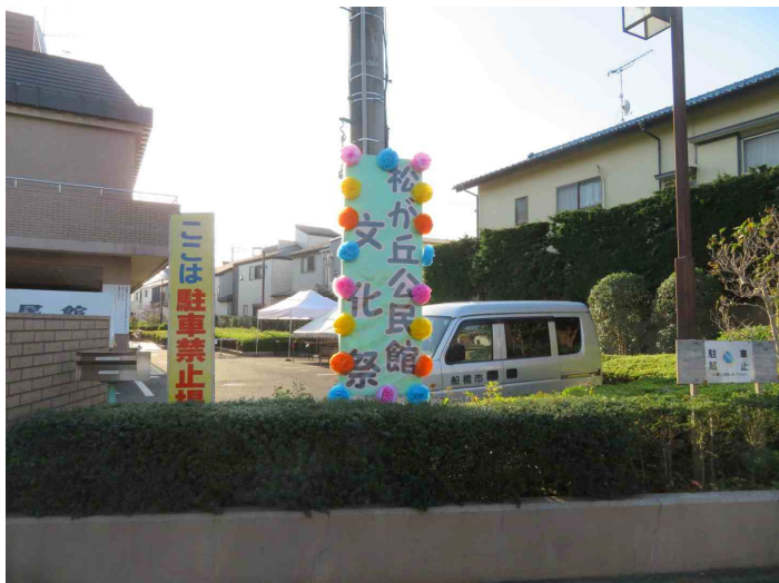
こちらが会場の松ヶ丘公民館です。