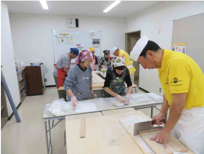
持ち帰りそばのパック詰めです。