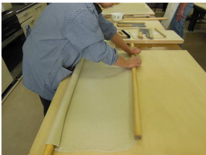
本のし、良く出来てます。