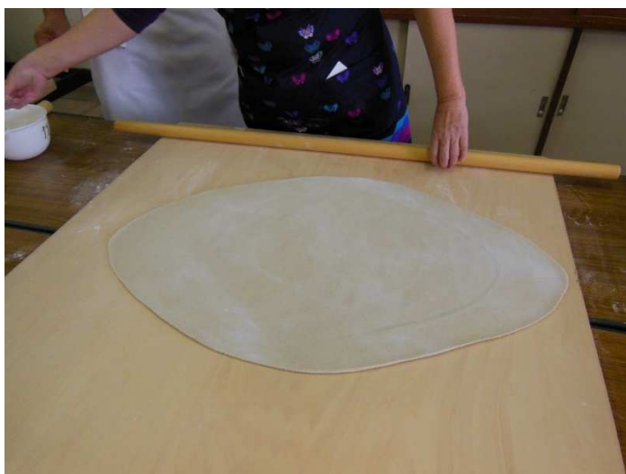
四つ出し、ラグビーボールの形です。