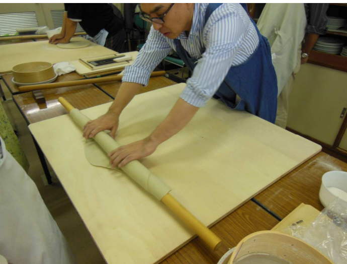
四つ出しの粉、両サイドにもお願いします。