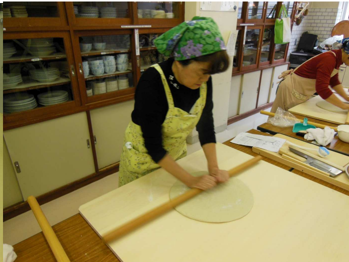
地のし OK、丸出しです。