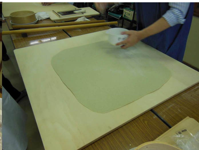
四つ出し終わって開きました。肉分けに打粉は不要ですよ。