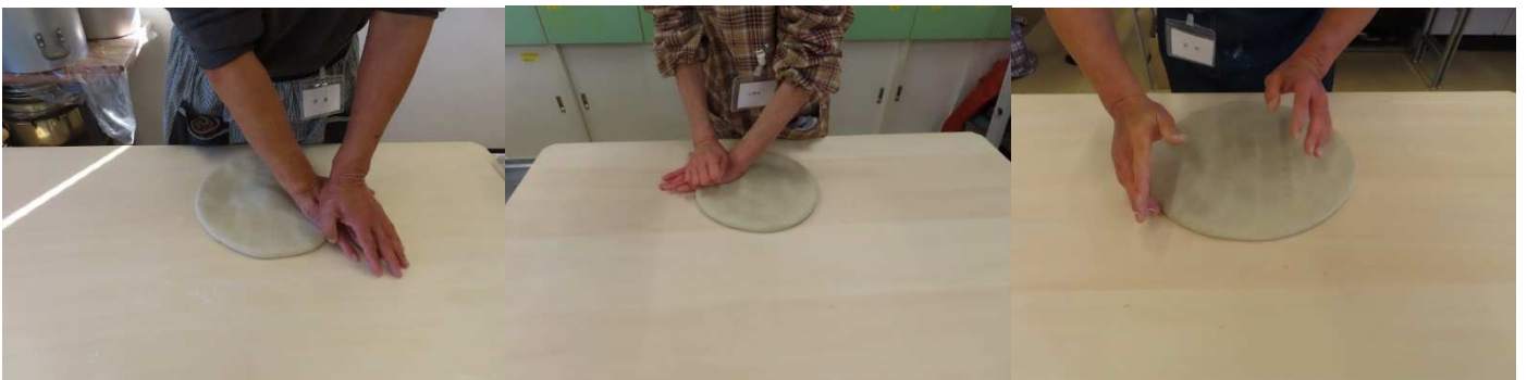
鏡出し、手のひらで押して大きくします。