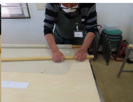
四角になったら肉分けします。