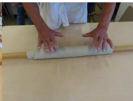
麺棒に巻いて四角にします。