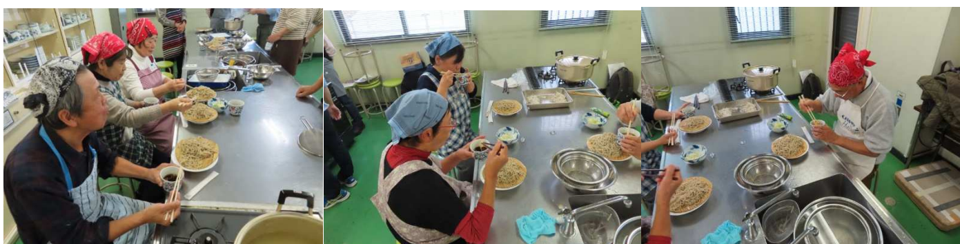
美味しいですと仰っています。