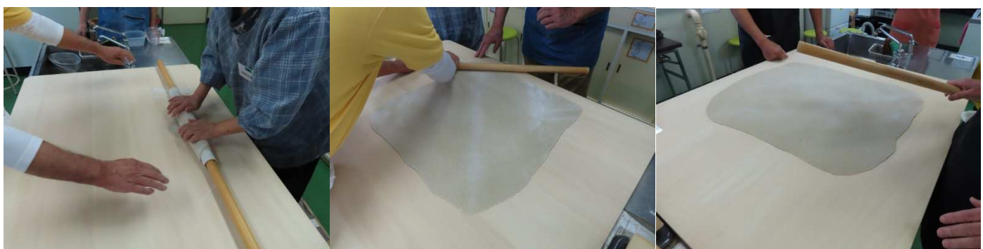
四角にして延します。