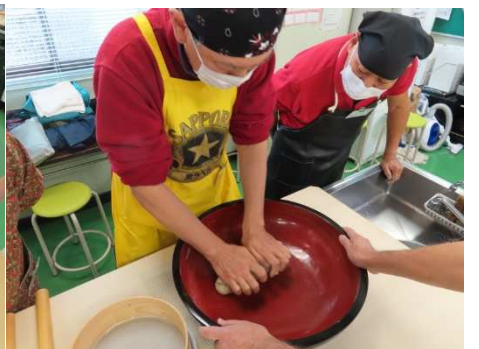
よいしょ、よいしょ力が要りますね。