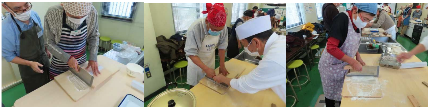
切りに苦労してます。アドバイスして。