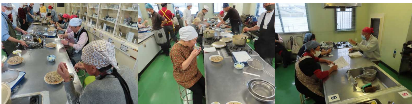
終わってアンケートを書きます。