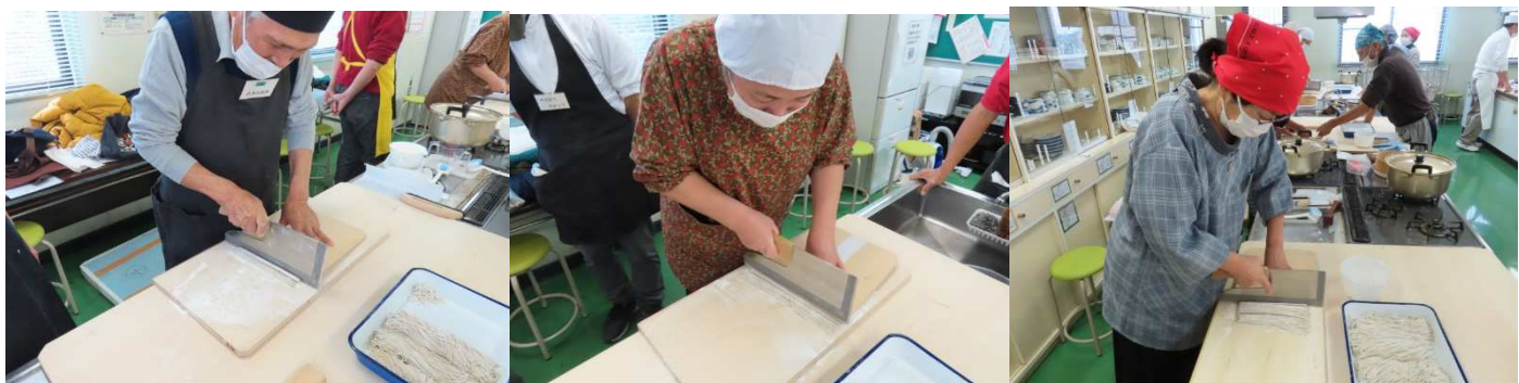
切ります。なかなか旨く切れません