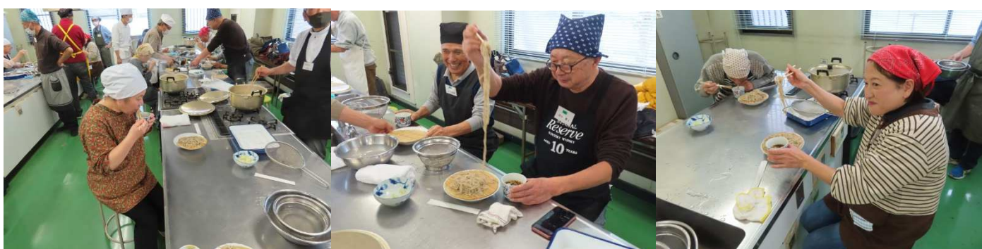
長いですね、水回しが良かったですね。