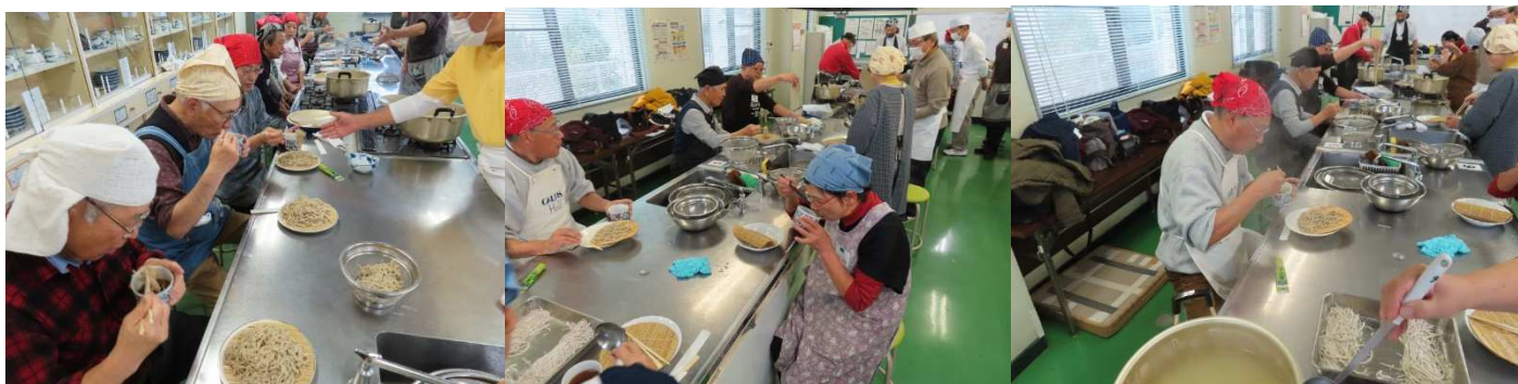
皆さん美味しいと舌鼓。