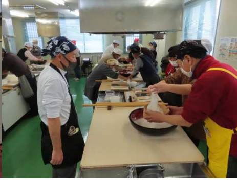
皆さんのそば打ち、始まりはじまり。