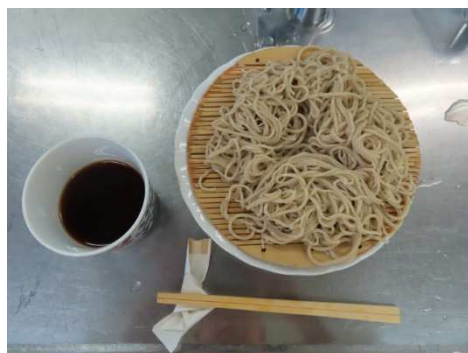
私たちの賄い、皆さんと同じもりそばです。