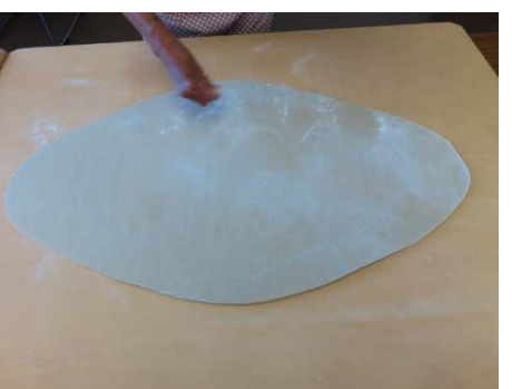
四つだし、四角にします。