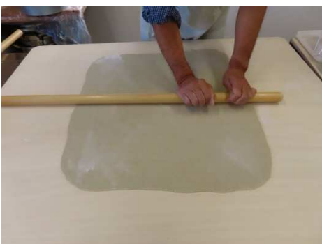
四角にして肉分けです。