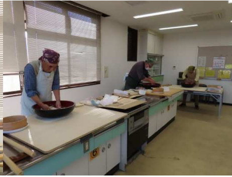
そば打ち始めました。