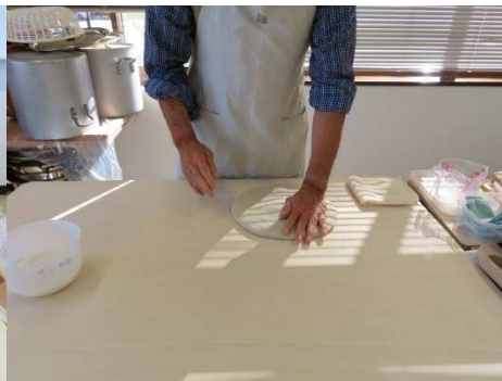
地のし、鏡出しです。