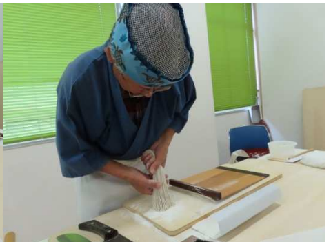
切って打ち粉を落とします。