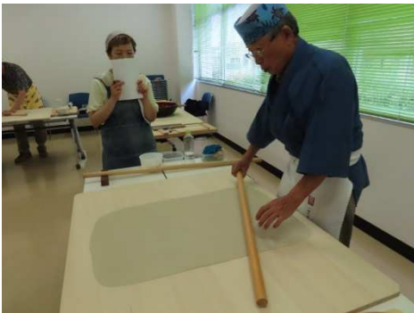
そばの長さを作る延しです。