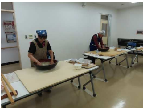
会員のそば打ちが始まりました。