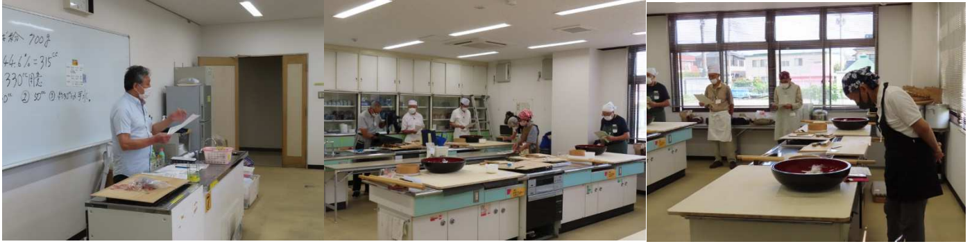
会長の朝礼です。文化祭出店について役割分担など説明がありました。