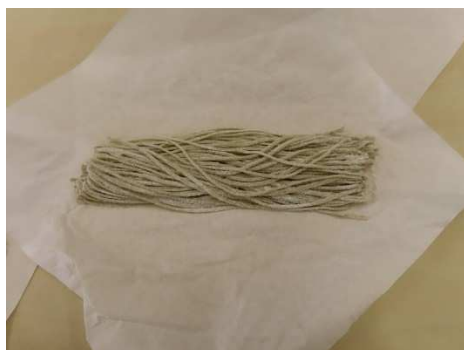
新人が切りました。