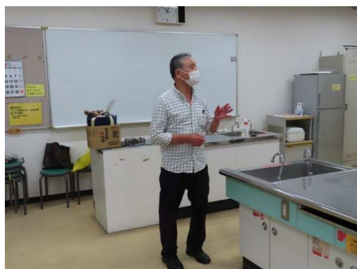
今期の会長抱負を述べる。