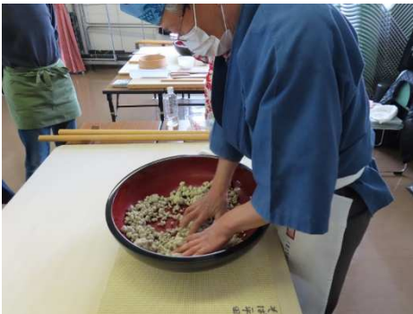
水回し、造粒してます。