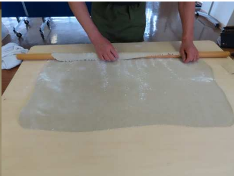
延し終わりました。