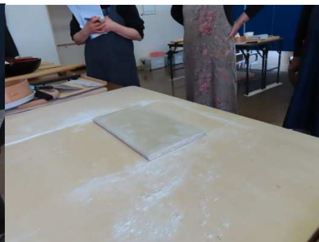
延してたたみました。