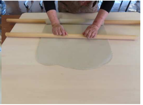
そば打ちの長さに延す。