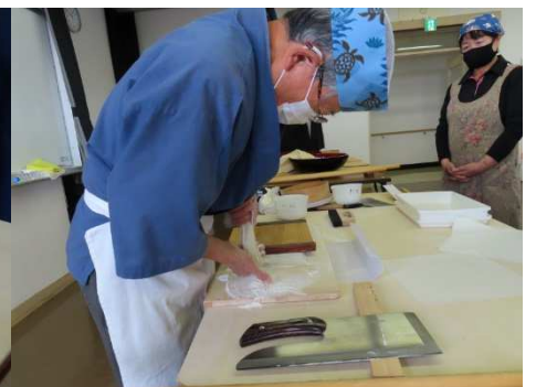
切って打ち粉を落とします。