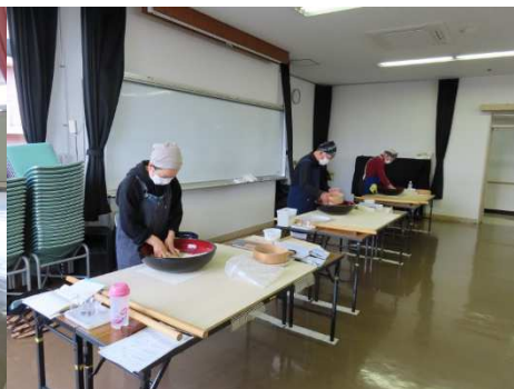
会員のそば打ち、水回しです。