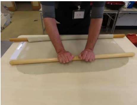
全体を薄く延します。