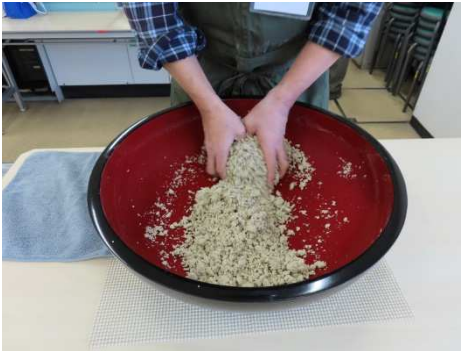
もう少し水が入りますね。