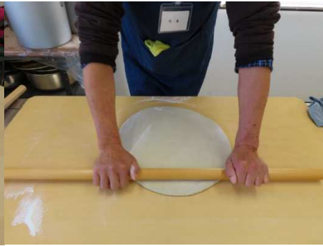
麺棒で丸く延します。