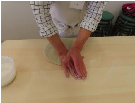
鏡だし、手のひらで押し広げます。