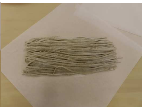
指導後良くなりました。