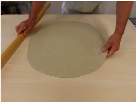
丸、やや不十分ですが厚み重視。