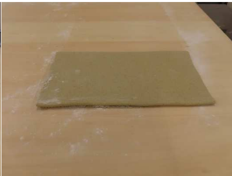
延してたたみました。厚み不均一ですね。