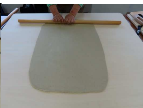
今日のそばの長さを決めます。