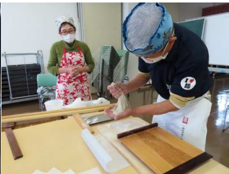
切って余分な打粉を落とします。