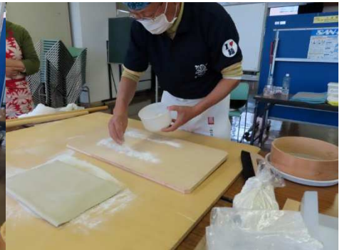
たたんで切り板に乗せます。