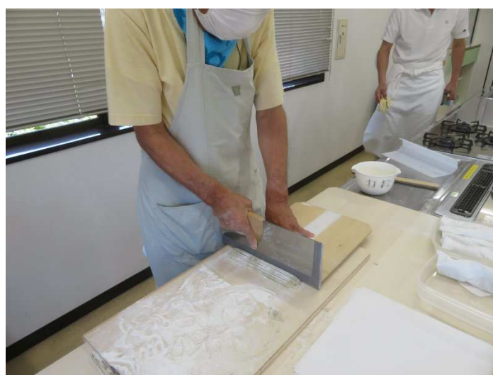
指導に専念したため写真が少なかったです。