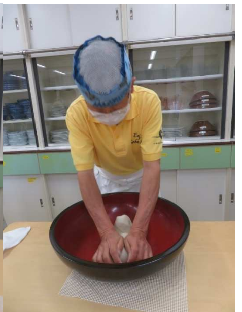
講師のテモ打ち、久しぶりです。