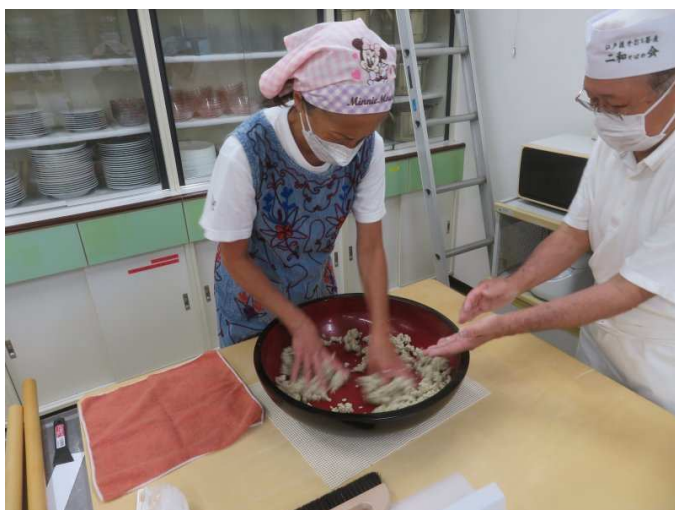
会員のそば打ち、講師のアドバイス。