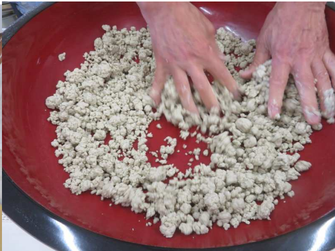
水回し、大きな粒が無くて良いですね。