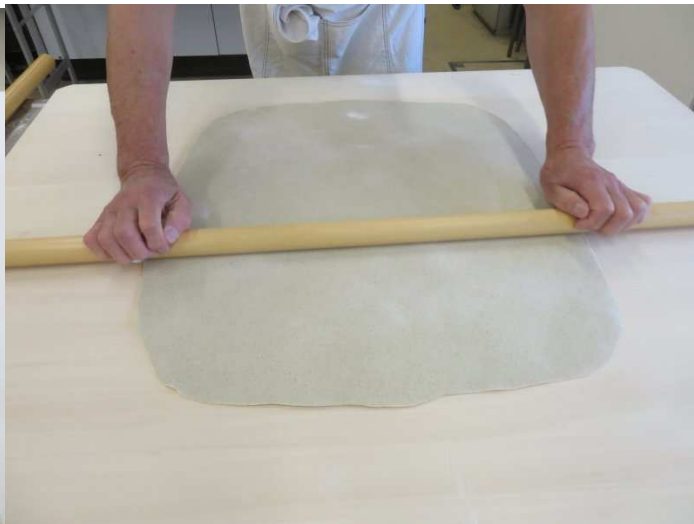
肉分けと今日のそばの長さを決めます。