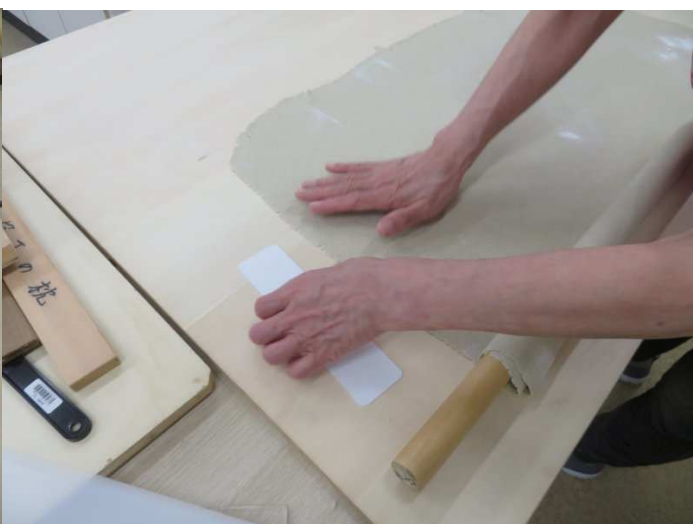
本延しです。厚みのチェック。