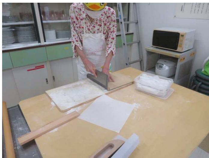
あと少しで切り終わりです。