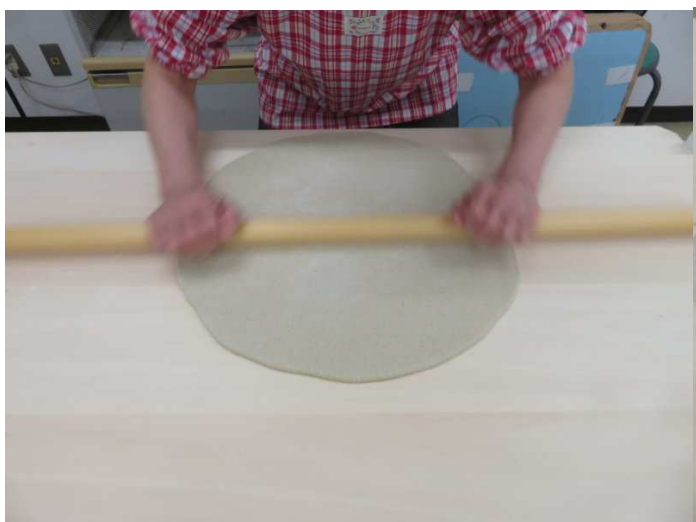
新人さんの丸出し、良いですよ。