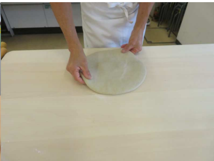
鏡出しです。厚み1cmと真ん中平らにね。