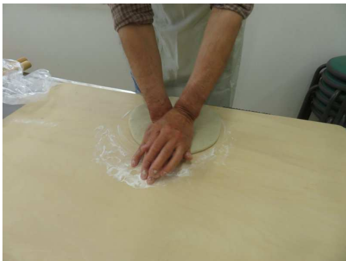
鏡だし、手で押していますが体全体で押します。