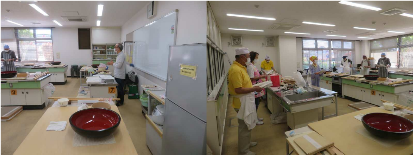
朝礼です。続いて総会が行われました。