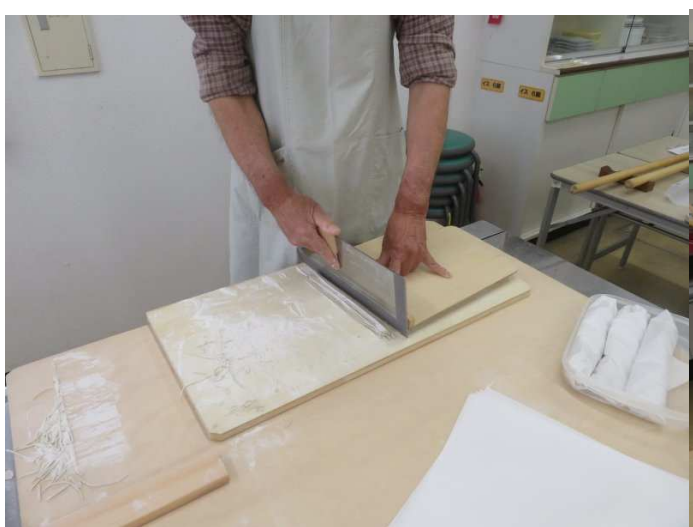
良く切っています。