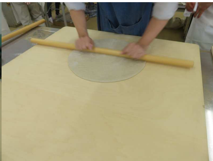
丸く大きくします。厚み5mm位です